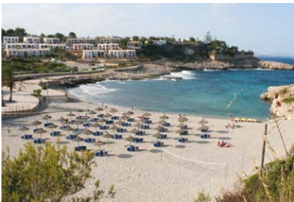
CALA MURADA · MALLORCA