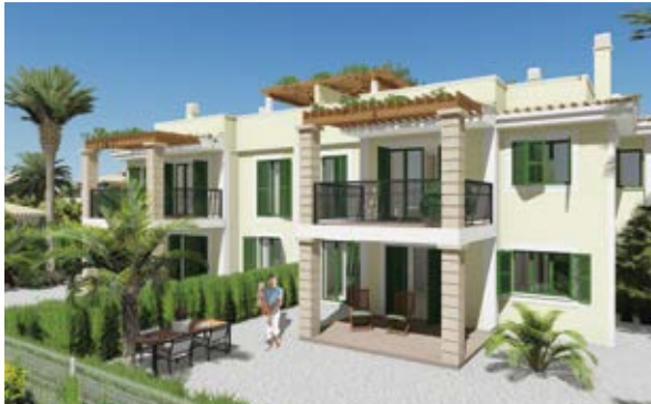
MÖBEL UND AUSSTATTUNGSPAKET OPTIONAL ERHÄLTICH