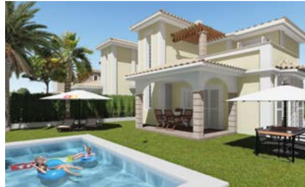
OPTIONAL FURNITURE & EQUIPMENT PACKAGES AVAILABLE