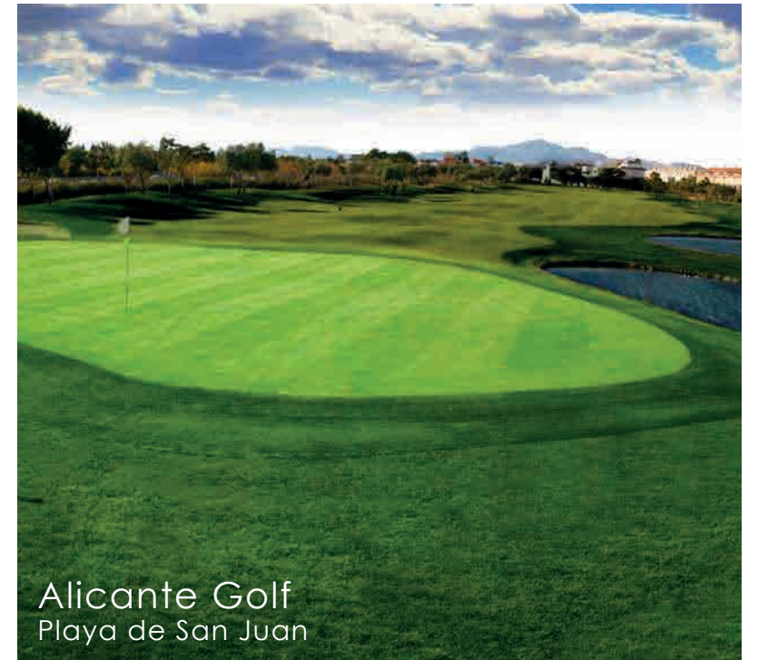
Alicante Golf Playa de San Juan