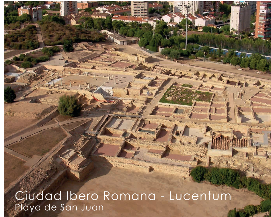
Ciudad Ibero Romana - Lucentum Playa de San Juan