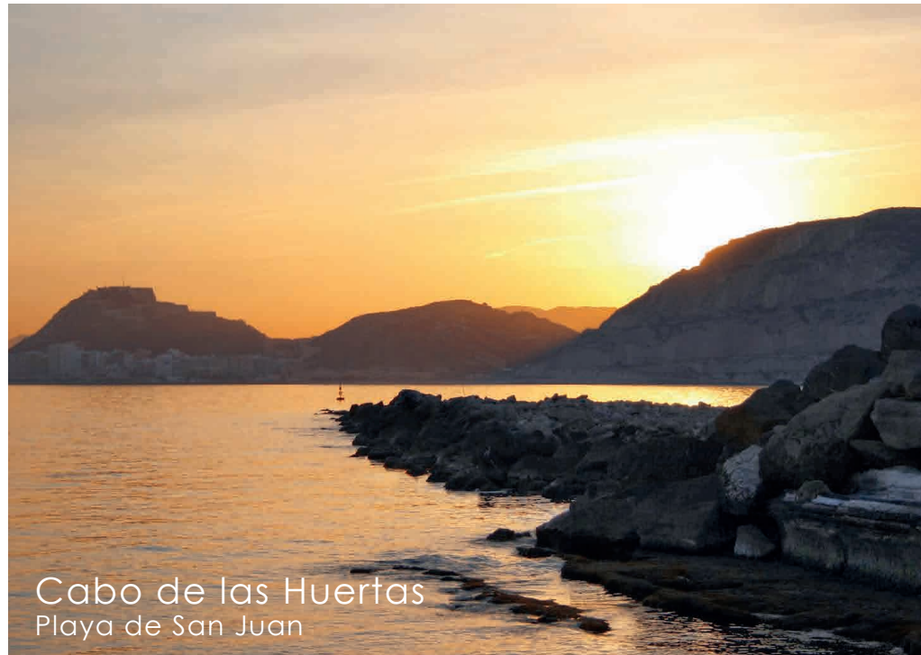
Cabo de las Huertas Playa de San Juan