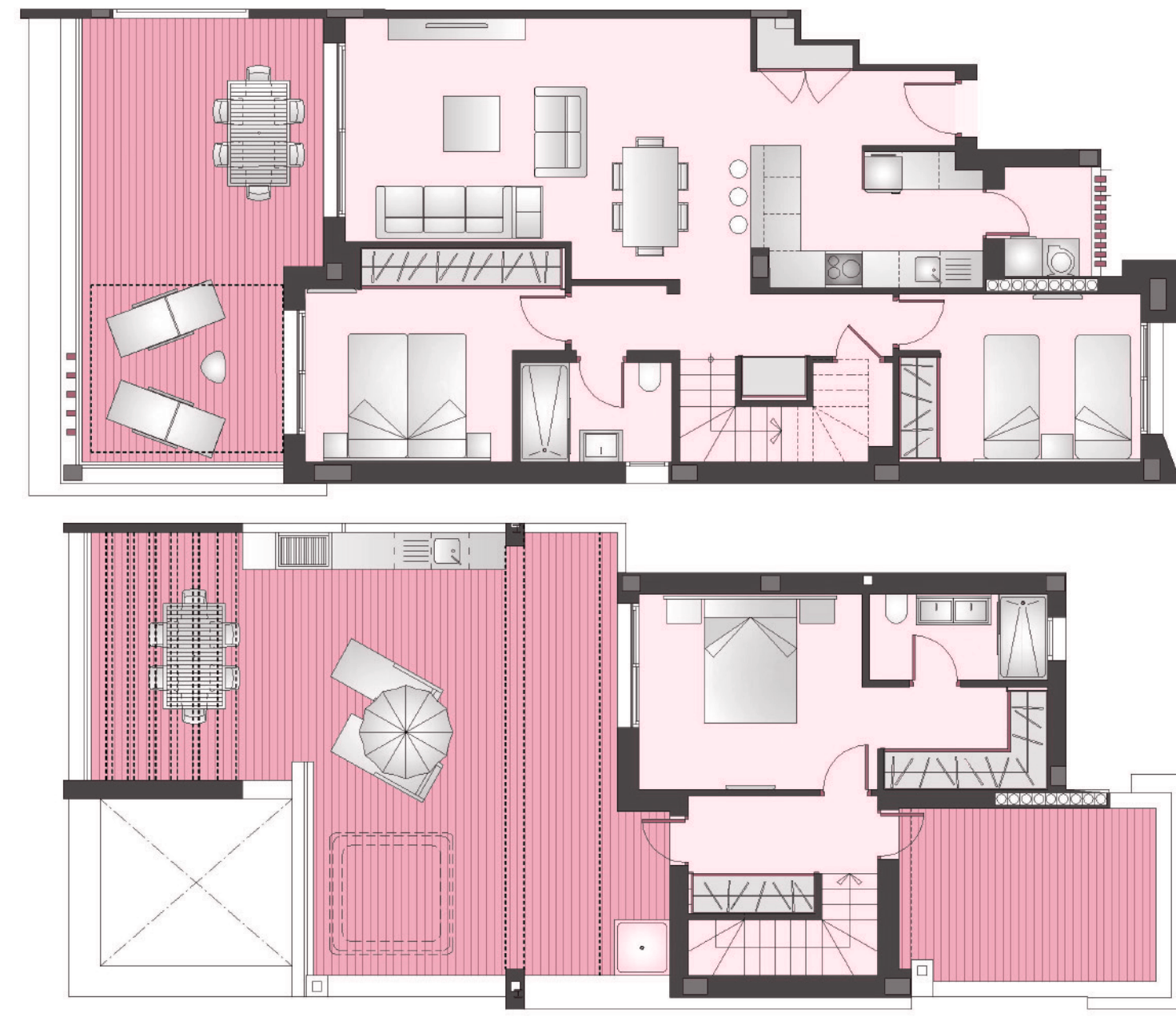
Apartamento 3 dormitorios + 2 Baños + Solarium Apartment 3 Bedroom + 2 Bathroom + Sun Terrace