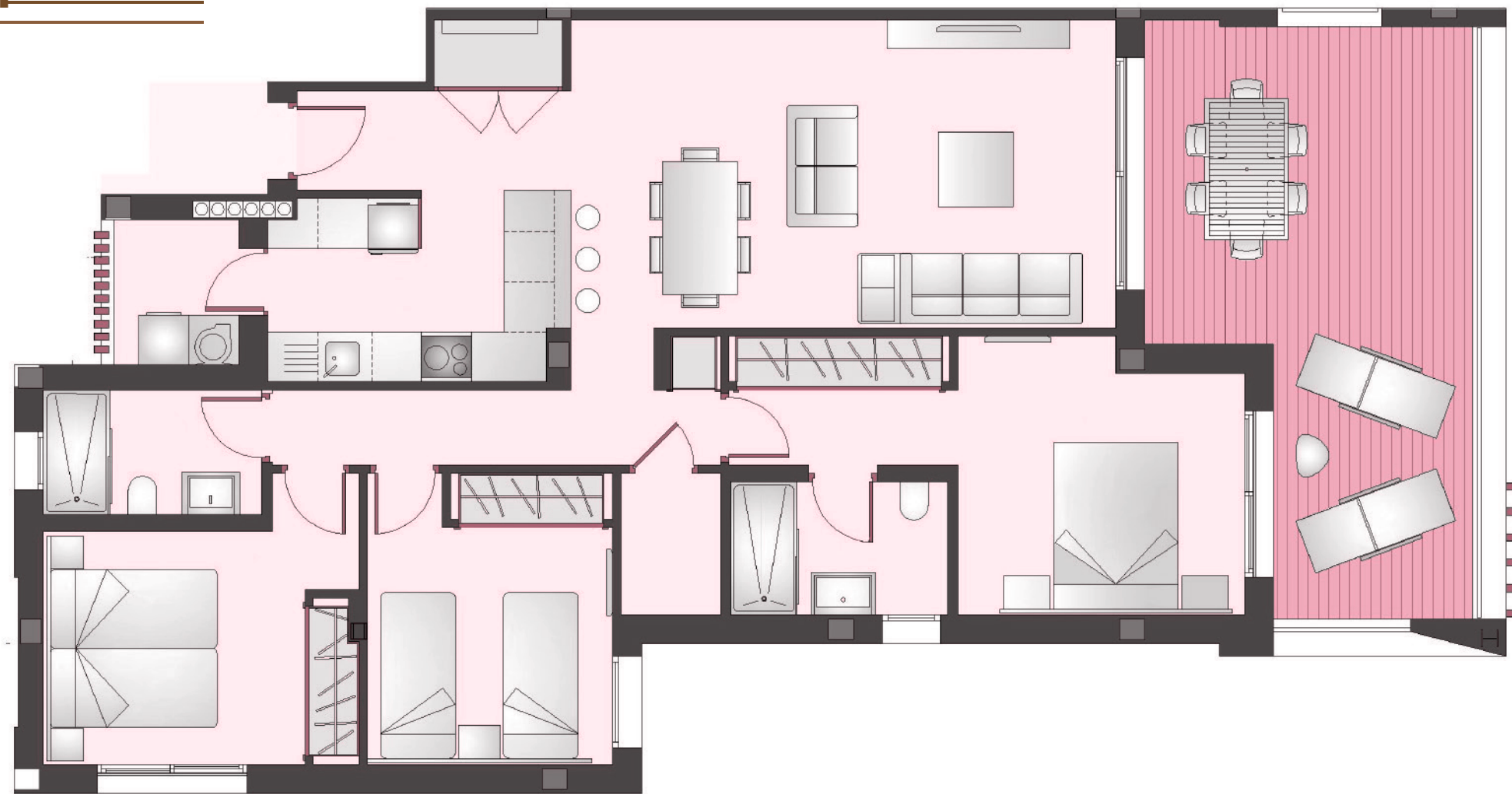
Apartamento 3 dormitorios + 2 Baños Apartment 3 Bedroom + 2 Bathroom.