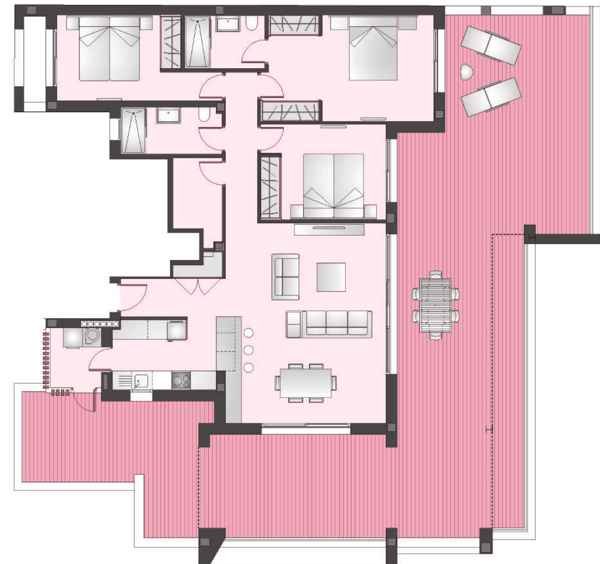
Apartamento 3 dormitorios + 3 Baños Apartment 3 Bedroom + 3 Bathroom.

Plano comercial sin valor contractual sujeto a posibles modificaciones por razones o exigencias de índole técnica o jurídica. Las superficies son aproximadas. Cocina y amueblamiento orientativo sin valor contractual. Commercial plan without contractual value subject to possible modifications for technical or legal reasons. Measurements shown are approximate. Kitchen and furnishing are for display purposes only, with no contractual value.